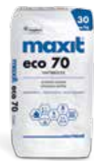
maxit eco 70 Haftbrücke | 30 kg