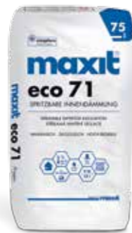
maxit eco 71 Spritzbare Innendämmung | 75 l