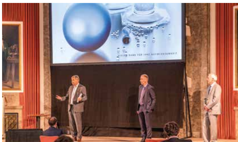
Die Nominierung zum Deutschen Zukunftspreis am 09.09.2020 im Ehrensaal des Deutschen Museums in München.